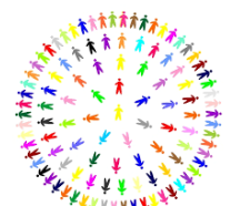
Discussions, échanges de pratiques