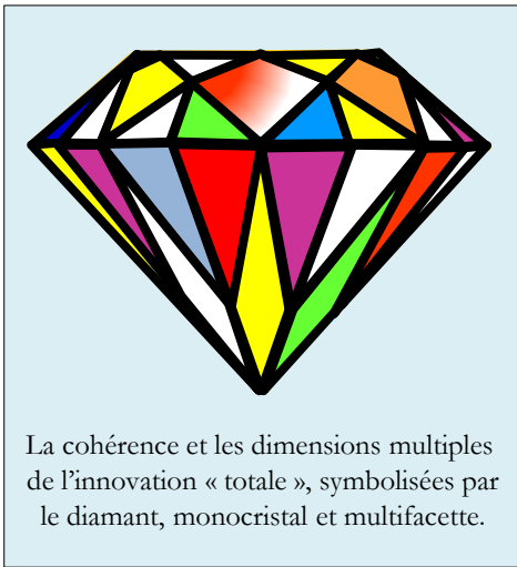
La cohérence et les dimensions multiples de l'innovation « totale », symbolisées par le diamant, monocristal et multifacette.

Gérer de façon pragmatique les dimensions multiples de l'innovation par la cohérence et la coopération